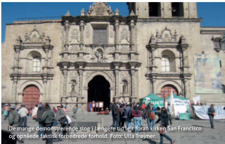
De mange demonstrerende slog i længere tid lejr foran kirken San Francisco og opnåede faktisk forbedrede forhold.

pensioner og ingen erstatninger. Der er intet sikkerhedsnet, og det er svært at få arbejde,” sagde Franzisca, da jeg besøgte hende.