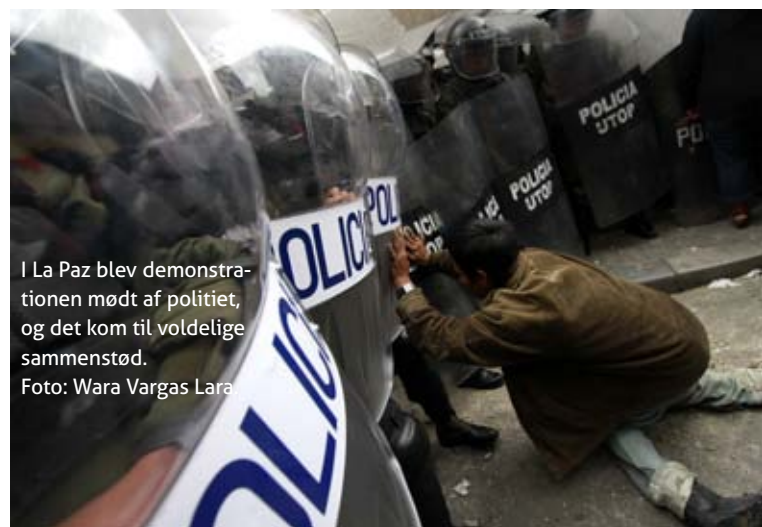
I La Paz blev demonstrationen mødt af politiet, og det kom til voldelige sammenstød.