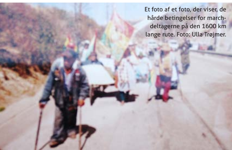
Et foto af et foto, der viser, de hårde betingelser for marchdeltagerne på den 1600 km lange rute.

“Det er ikke uden grund, at folk med handicap udsætter sig for så hårde prøvelser for at få opmærksomhed om deres sag. Mennesker med handicap får ingen eller små